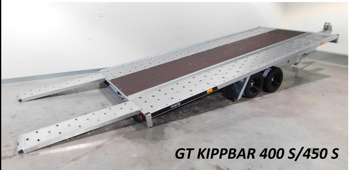
GT KIPPBAR 400 S/450 S