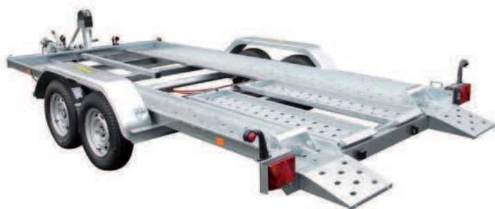
Photo de présentation : le kit rampes se met en lieu et place des becquets arrière

Avec kit hydraulique, treuil et support treuil et cales de roues montés d'origine