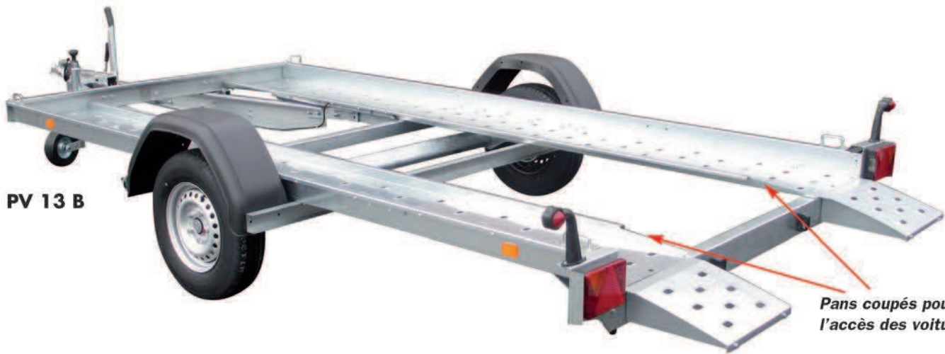
PV 13 B

Pans coupés pour faciliter l'accès des voitures basses