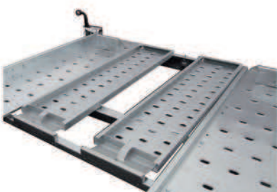
Options: cales de roue et kit rampes de montée