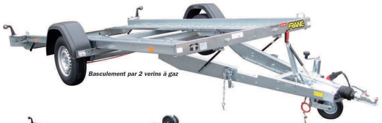
Basculement par 2 verins à gaz

Pans coupés pour faciliter l'accès des voitures basses